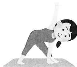
私は午がこんみにつかない しろ

その翌日は次男の高校の入学式。 大荒れの天気の中の移動は、結構キツかったけど、 無事に晴れ姿を見られて良かったです。 都立高校の入学式は同じ日なので、 定期を買うのに長蛇の列で1時間待ち(実際はそこまで待たずに買えたけど) その後バスで帰宅しました。