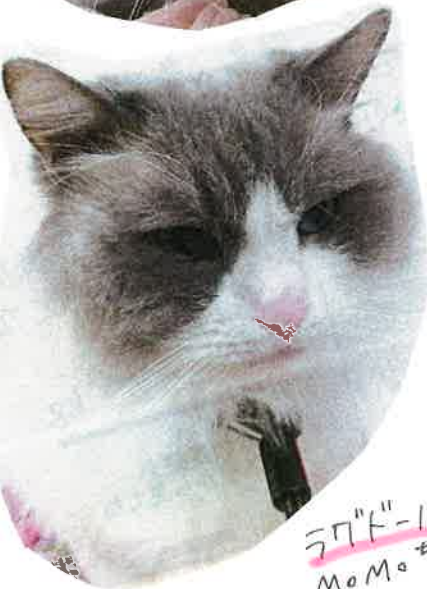
ラゴドール MoMoちゃん