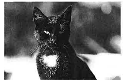
ねばおは「似てるけど」 ねばおじゃない子の写真

自分のお店でも同じようなことが、起きていないか十分に気を付けなければと思いました。しかもまた同じように大量出血してしまいました。さらにねばおの2回目の再生医療の点滴の日とかぶってしまい、フラフラしながら西東京市の病院まで行ってきました。