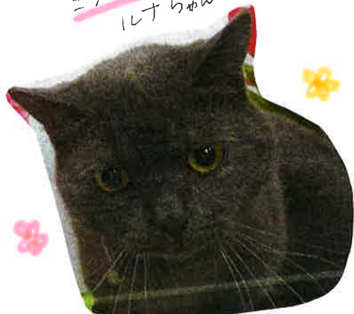
ミヌエット ルナちゃん