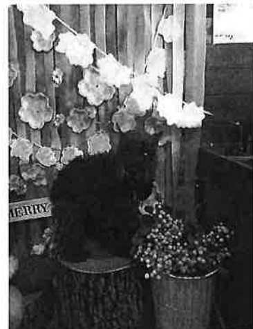
↑ ドッグカフェの写真 ブース

その翌日は次男の高校の入学式。 大荒れの天気の中の移動は、結構キツかったけど、 無事に晴れ姿を見られて良かったです。 都立高校の入学式は同じ日なので、 定期を買うのに長蛇の列で1時間待ち(実際はそこまで待たずに買えたけど) その後バスで帰宅しました。